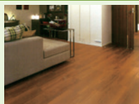
▲高耐久メラミンフロアー一例 「エレガントオーセンティック」