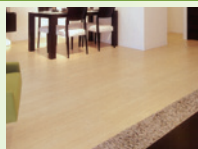
▲高耐久メラミンフロアー一例 「ライトナチュラル」