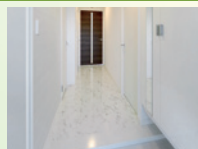
▲高耐久メラミンフロアー一例 「マーブルピアンコ」